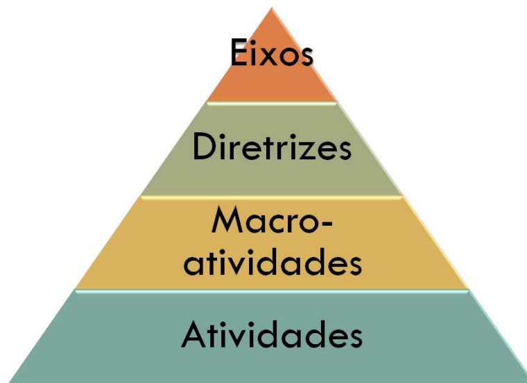
Figura 2 - Estrutura do Plano de Ação

Em função da complexidade das ações a serem realizadas pela SMCTDES, foi definida uma estrutura de detalhamento dos eixos estratégicos propostos na Figura 1. Essa estrutura pode ser visualizada na Figura 2.